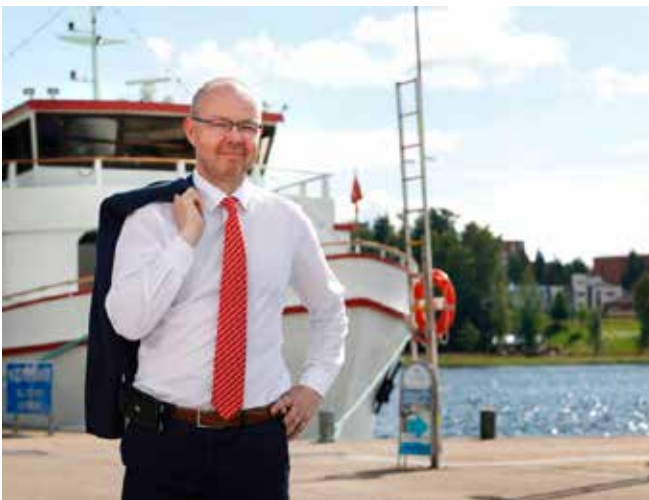
Timo Koivisto kaupunginjohtaja Jyväskylän kaupunki

Yli 145 000 asukkaan vireä Jyväskylä on kauneimmillaan kesällä. Toivon, että viihdytte kaupungissamme ja Kesäpäivät tarjoavat teille hyvät puitteet keskustelulle ja verkostoitumiselle.