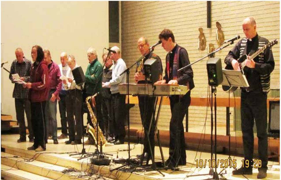
Viis papeista konsertoi Kokkolan kirkossa 10.10 2015. Konsertissa laului myös meidän oma katulähetyskööri Bäggarinpojat.

Tästä on hyvä jatkaa....rakkaudessa Kristuksen!