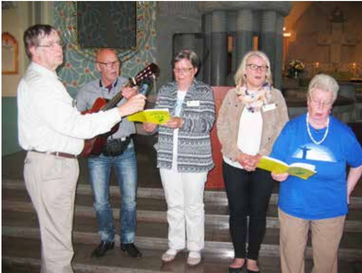
Laitilan Katulähetyksen tervehdys.