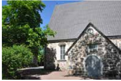
Pyhän Mikaelin kirkko

Se, joka nöyrtyy tämän lapsen kaltaiseksi, on suurin taivasten valtakunnassa. Ja joka minun nimessäni ottaa luokseen yhdenkin tällaisen lapsen, se ottaa luokseen minut. Mutta jos joku johdattaa lankeemukseen yhdenkin näistä vähäisistä, jotka uskovat minuun, hänelle olisi parempi, että hänen kaulaansa pantaisiin myllynkivi ja hänet upotettaisiin meren syvyyteen.