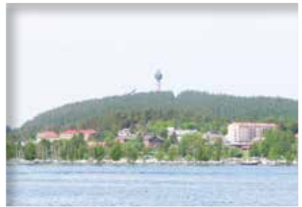
Puijon mäki kuvattuna Kallavedeltä.