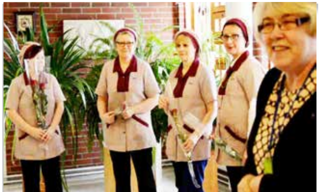
Porin päivien tärkeät henkilöt keittiöltä.