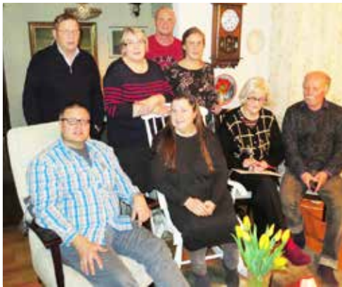
Porin päivien suunnittelukokous.